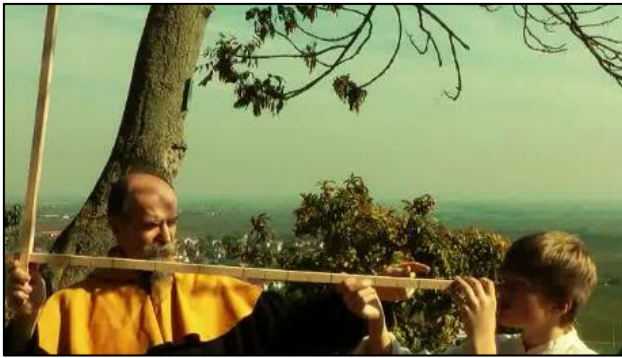
Abb. 2: Filmausschnitt