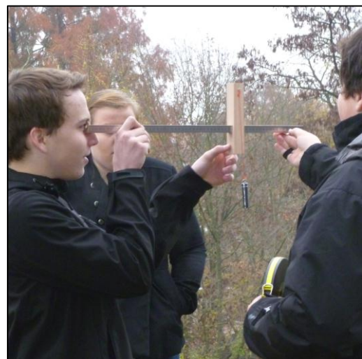
Abb. 3: Messen mit dem Jakobsstab ►

In der folgenden Doppelstunde werden die erworbenen Erkenntnisse genutzt um die Höhe eines Baums mit einem realen Jakobsstab zu bestimmen. Zur Vorbereitung dazu erarbeiten sich die Schüler die Handhabung des Jakobsstabs anhand einer Simulation (vgl. Abb. 3). Diese erleichtert auch das Herstellen der Beziehung zwischen dem Strahlensatz und der Messkonfiguration. Anschließend messen die Schüler mit dem Jakobsstab